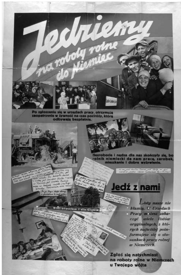
Zmobilizowanie Polaków do wyjazdu na roboty do Rzeszy stanowiło jedno z pierwszych zadań niemieckiej propagandy w GG.

przesłania czysto antyalianckie nie wywołują wśród Polaków żadnego echa. Dlatego od drugiego roku wojny propaganda wizualna zaczęła sugerować, że za plecami łatwowiernych aliantów czai się prawdziwy wróg – Żyd.