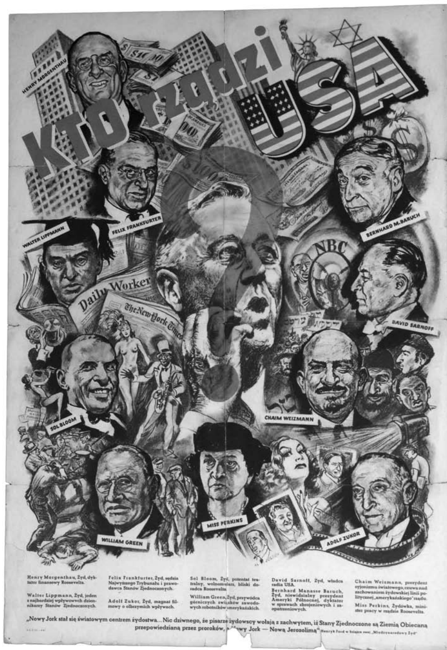
Henry Morgenthau, Żyd, dyktator finansowy Roosevelta.