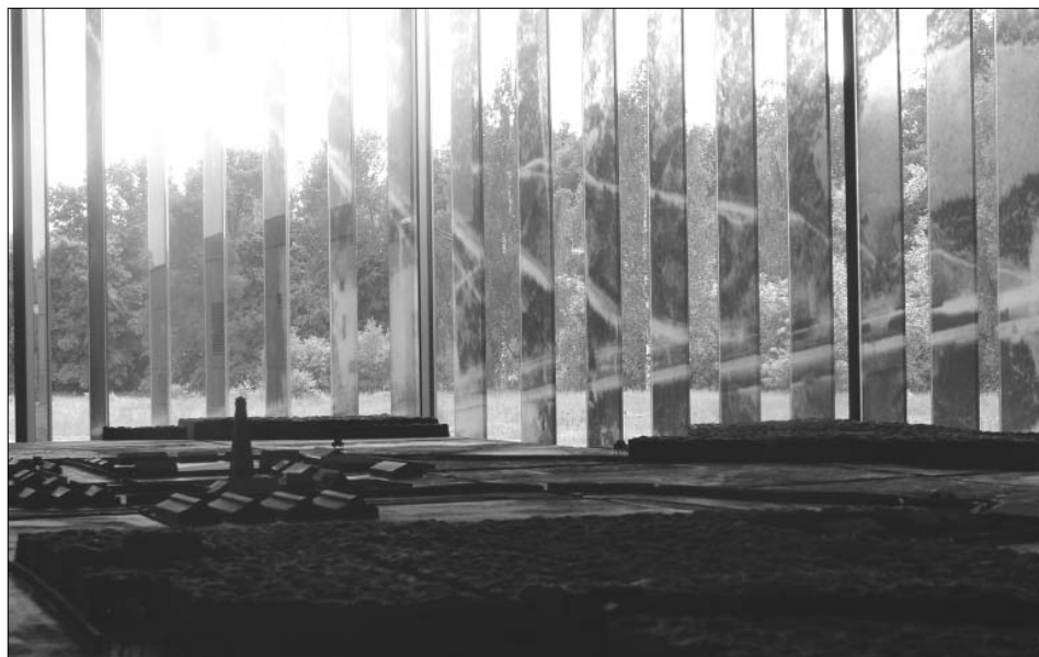
Makieta obozu powstała na podstawie świadectw historycznych i wyników badań archeologicznych

Historia obozu pokazana została w szerszym kontekście niemieckiej polityki eksterminacyjnej wobec europejskich Żydów. Opisane zostało miejsce i znaczenie ośrodka w akcji „Reinhardt”, w zagładzie Żydów z okupowanej Polski, a także ze Słowacji, z Holandii oraz innych krajów Europy. Na wystawie mowa jest też o samej logistyce Zagłady, organizacji oraz funkcjonowaniu obozu, członkach załogi obozowej, jak również o żydowskich więźniach zmuszonych do pracy przy jego obsłudze, o próbach ucieczki i przebiegu powstania. Ostatni rozdział ekspozycji poświęcono powojennej historii i pamięci tego miejsca zbrodni, jego późnemu i raczej skromnemu upamiętnieniu, losom osób ocalałych z obozu oraz ich oprawców.