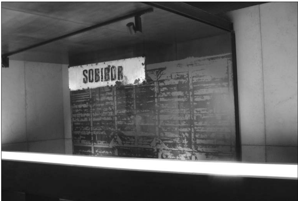
Instalacja przypominająca rampę kolejową