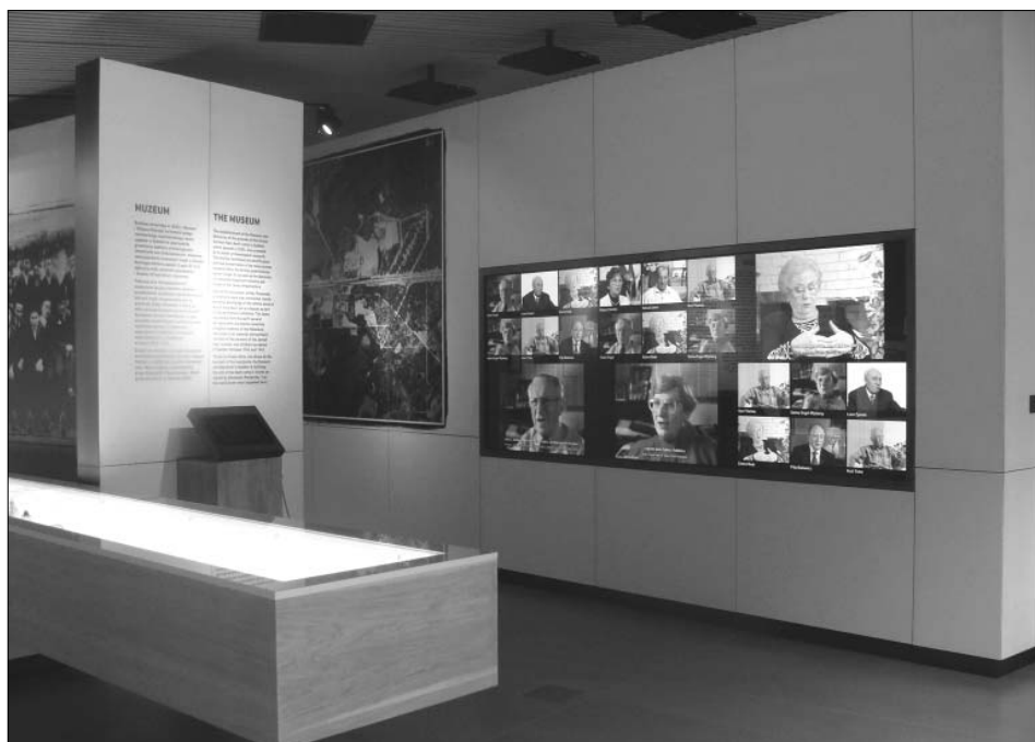
Końcowa sala ekspozycji, w której umieszczono nagrania filmowe z relacjami osób ocalałych z Sobiboru

W Sobiborze relacjom osobistym przypisano skromniejsze miejsce. Nie świadczy to bynajmniej o braku szacunku dla ofiar lub o chęci podważenia ich wiarygodności jako świadków. Wręcz przeciwnie, za pośrednictwem zdjęć i artefaktów ekspozycja przywraca pamięć o indywidualnych osobach, ofiarach obozu i uczestnikach powstania. Autorzy scenariusza są jednak wyraźnie zwolennikami bardziej pozytywistycznego podejścia do świadectw historycznych. Zdają się mówić: relacje świadków, tak samo jak wszystkie inne źródła historyczne, muszą podlegać krytycznej analizie. Muszą zostać poddane ocenie historyka, zinterpretowane i umieszczone we właściwym kontekście. Surowe, nieopracowane relacje, zwłaszcza takie, które powstały wiele lat po wojnie, należą raczej do domeny pamięci, a nie historii.