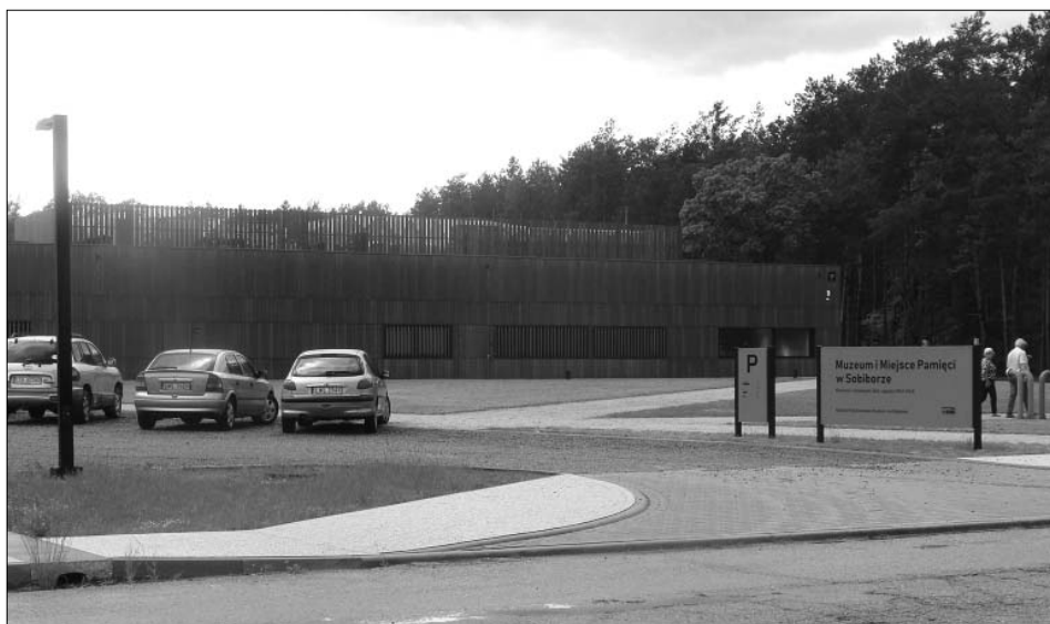
Nowo powstały, minimalistyczny budynek muzeum

Muzeum ulokowane jest w parterowym, minimalistycznym budynku. Łączy on dwie, oddzielone w przestrzennej koncepcji upamiętnienia tego miejsca strefy: Lager III, czyli właściwy ośrodek zagłady, na którego terenie znajdowały się komory gazowe oraz masowe mogiły ofiar, oraz Lager I (obóz I), w którym przetrzymywani byli żydowscy więźniowie: mężczyźni i kobiety. Byli oni