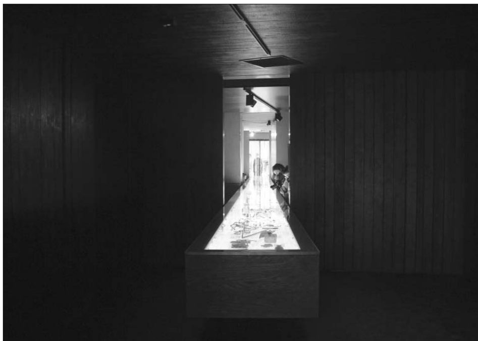
Ciemne pomieszczenie wyłożone zwęglonym drewnem przywodzi na myśl wnętrze komory gazowej lub baraku obozowego

alnej 18 . Stanowią one oryginalny wkład projektantów ekspozycji, którzy są też współautorami wystawy stałej Muzeum Postania Warszawskiego oraz autorami multimedialnej ekspozycji Muzeum Dom Rodzinny Ojca Św. Jana Pawła II w Wadowicach. Instalacje te nawiązują „do historycznego wyglądu obozu” i dzięki temu pozwalają również „odtworzyć wizualną pamięć miejsca” 19 .