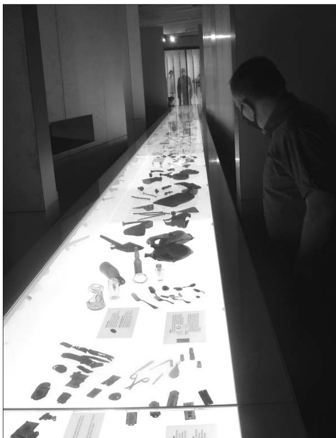
Trzon nowej ekspozycji stanowią artefakty znalezione podczas prac archeologicznych

dycją tworzenia wystaw historycznych poświęconych drugiej wojnie światowej i Holokaustowi 13 . Sztandarowym przykładem takiego podejścia są stara i nowa, otwarta w 2016 r., ekspozycja w Muzeum i Miejscu Pamięci na terenie byłego nazistowskiego obozu koncentracyjnego Buchenwald 14 . Podobny charakter ma również udostępniona w 2004 r. stała wystawa na terenie Muzeum i Miejsca Pamięci w Bełżcu – filii Państwowego Muzeum na Majdanku.